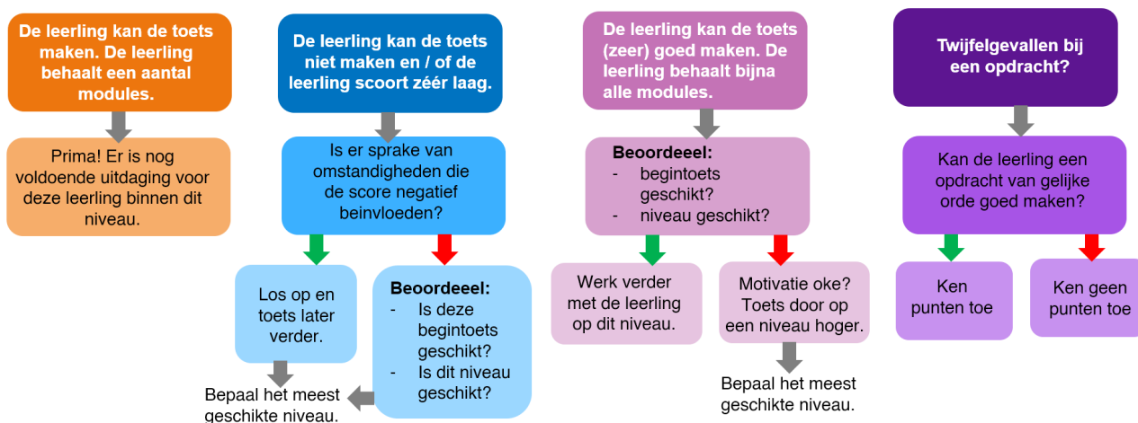
Figuur: kijkwijzer begintoets

NB: de begintoets is een hulpmiddel om het startniveau van de leerling te bepalen, en geen afrekenmodel!